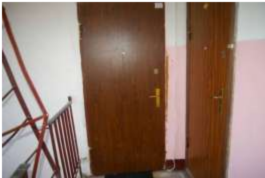
Dzīvojamā ēka ar kadastra apzīmējumu 1700 002 0247 007, dzīvoklis Nr.13