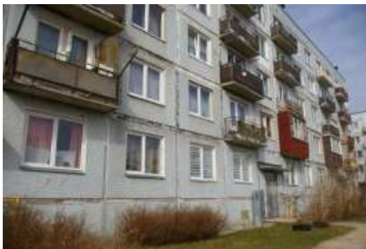
Būve ar kadastra apzīmējumu 1700 002 0247 007