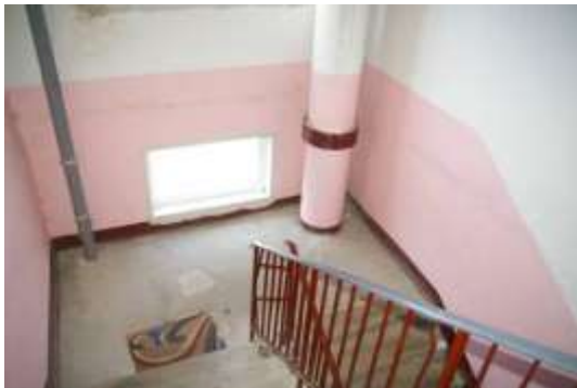
Būve ar kadastra apzīmējumu 1700 002 0247 007, koplietošanas telpa